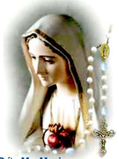
Đức Mẹ Maria

Hôm nay ngày bảy tháng năm Kính dâng lên Mẹ tấm lòng chúng con Đóa hoa tươi thắm sắt son Mẹ vui nhận lấy cho con thỏa lòng Khẩn cầu cùng Mẹ ban cho Gia đình, giáo xứ ấm no phúc lành Xứ đoàn con mới hình thành Xin Mẹ nâng đỡ dắt dìu chúng con Vượt qua sóng gió trần gian Hồn an, xác mạnh xin vâng cùng Mẹ Mẹ là mẫu gương tuyệt vời Thiên Chúa đón nhận về Trời cùng Cha Chúng con dâng Mẹ lời ca Dâng lên Thiên Chúa cảm tạ tri ân Phó thác nơi Mẹ tấm thân Để đời con được vui sống bằng yên.